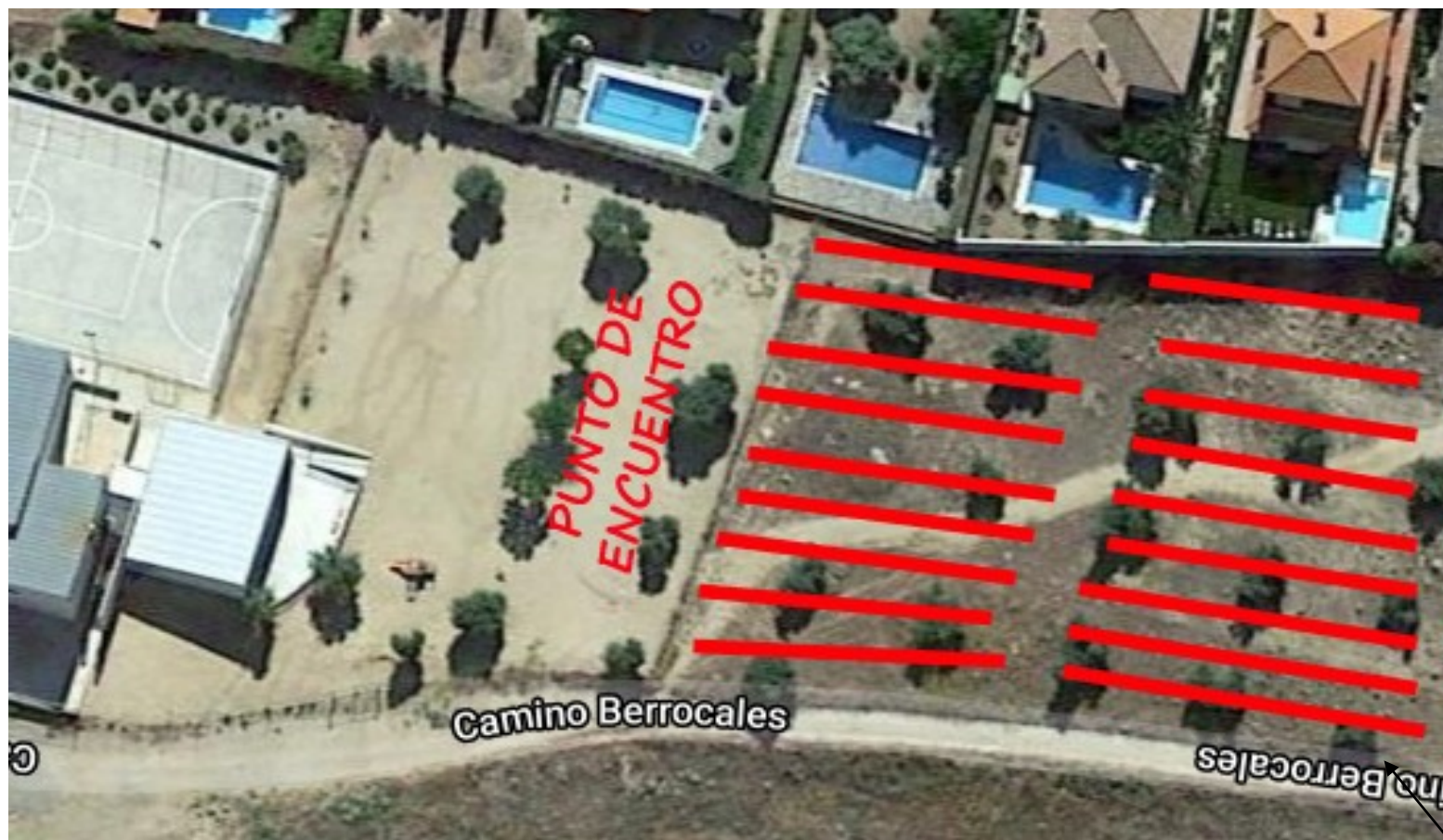
FORMACIÓN DE FILAS PARA RECUENTO